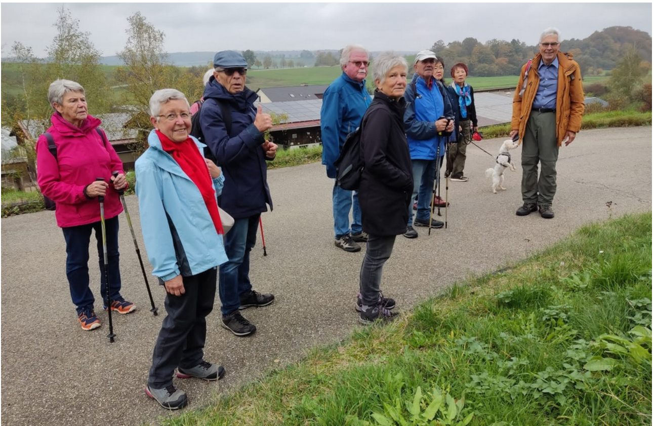
Wanderung auf dem Albschäferweg bei Steinheim