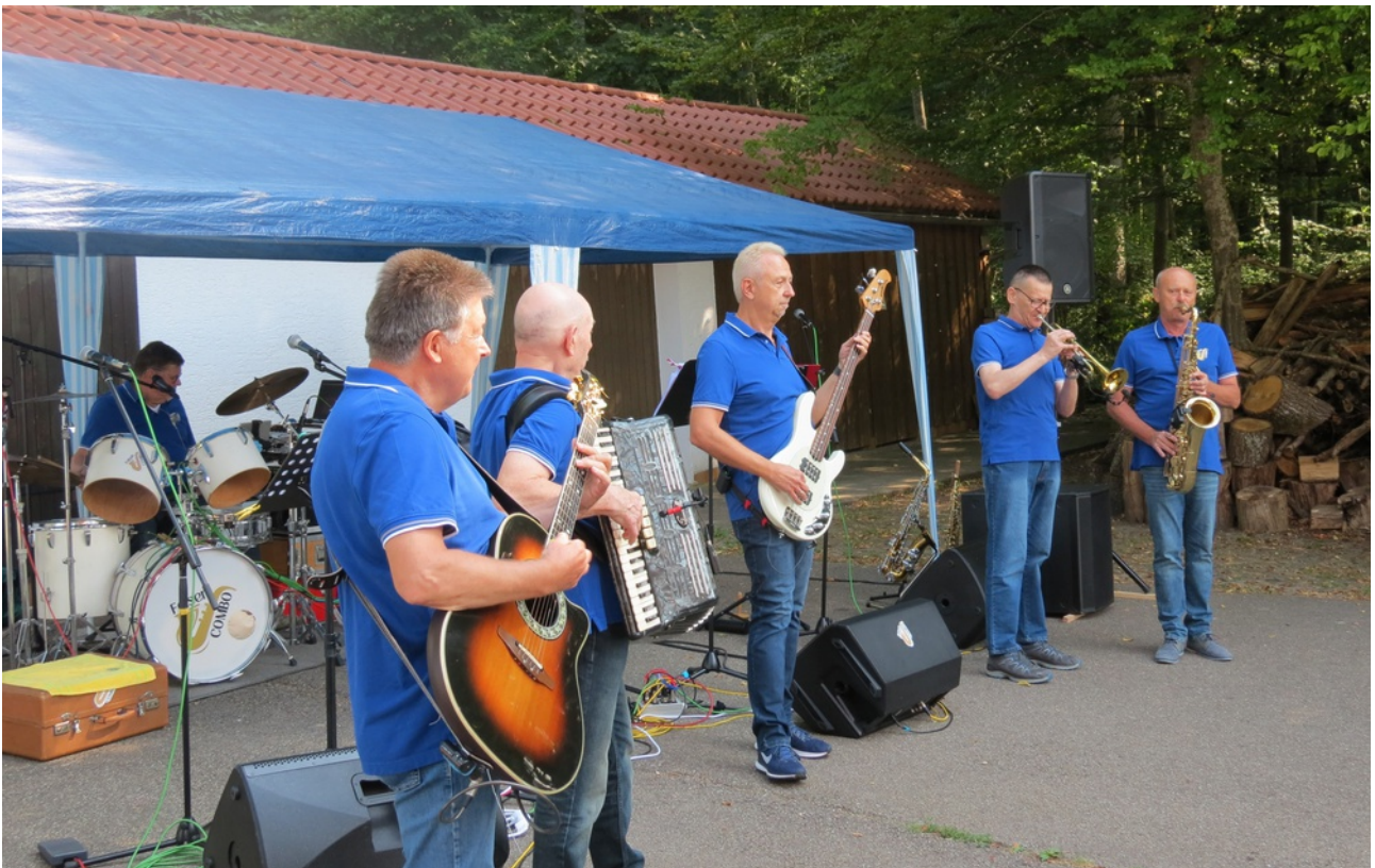
Die Felsencombo beim Weißwurstfrühschoppen im Hasenloch, der auch 2025 wieder stattfindet