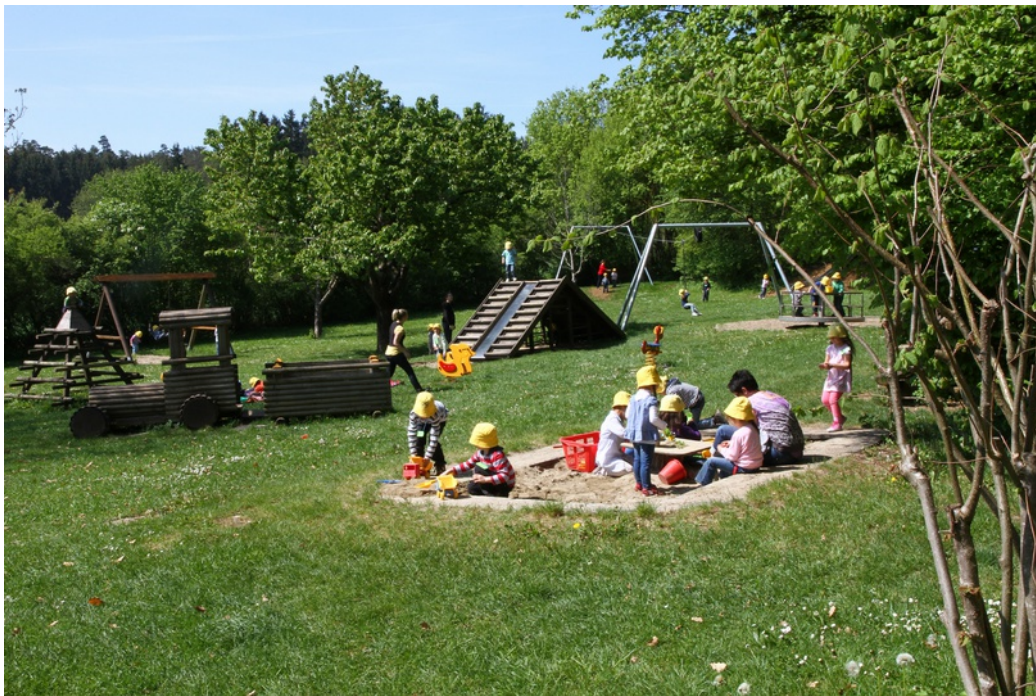
Der Hasenloch-Spielplatz – ein beliebter Familientreffpunkt

Wir bieten Mitgliedern, die keine eigene Möglichkeit haben, mit einem Kraftfahrzeug Veranstaltungen im Hasenloch zu besuchen, einen Fahrdienst an. Bitte hierzu die Mitglieder des Vorstandes ansprechen, die in dieser Programmheft mit ihren Kontaktdaten zu finden sind.