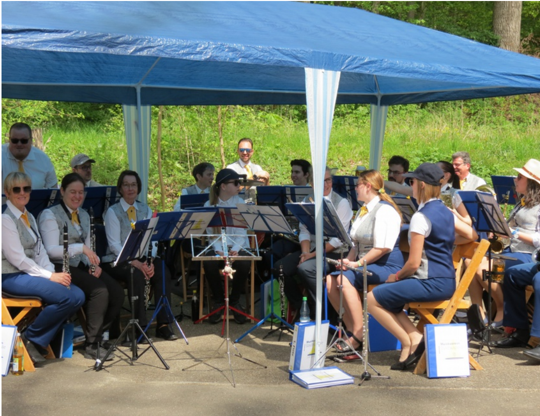
Maifest im NaturFreundehaus Hasenloch mit dem Musikverein Stadtkapelle 2024