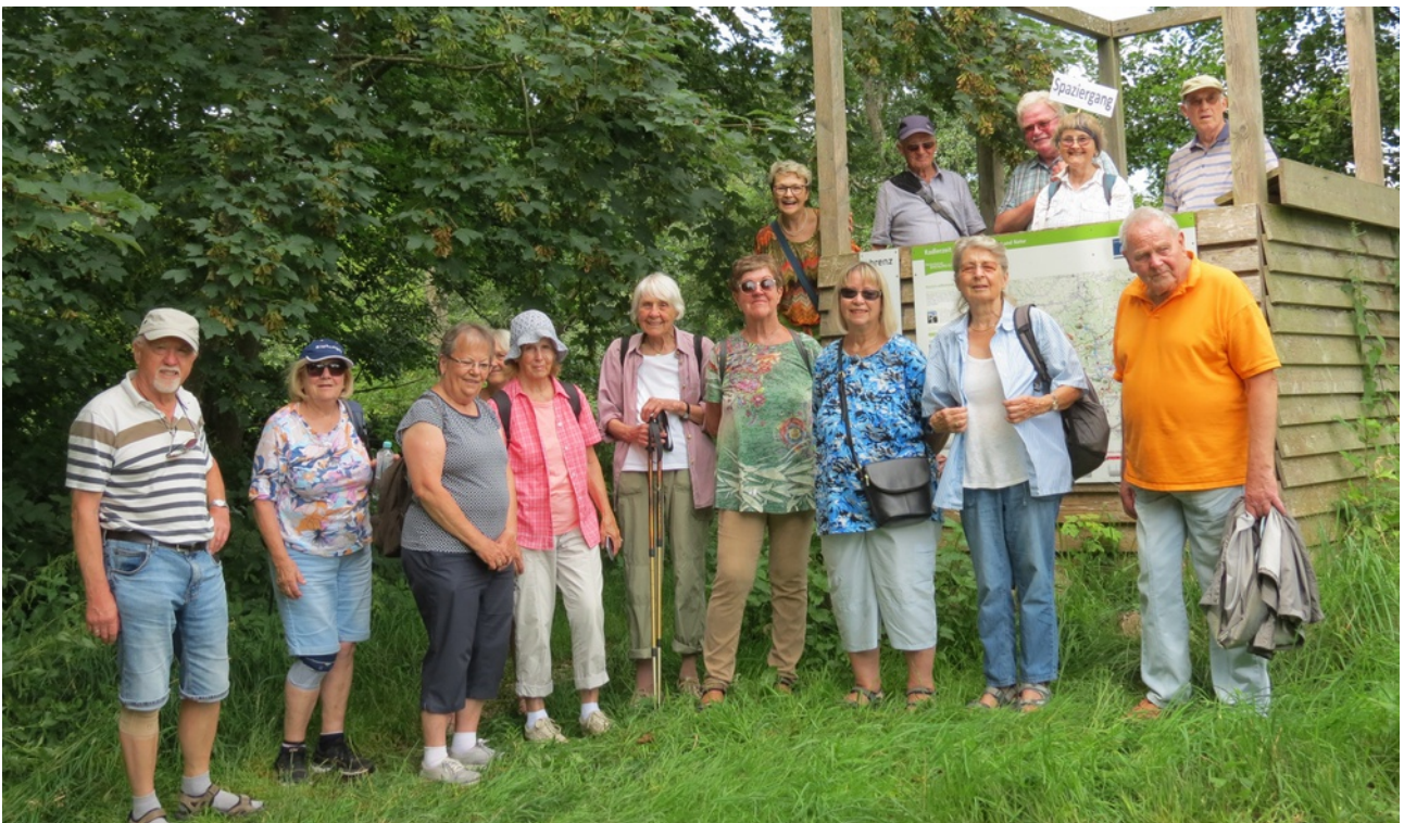
NaturFreunde-Senioren des NaturFreunde-Bezirks Südalb besichtigen die Ausgleichsmaßnahmen zum Umweltschutz im Ried in Giengen