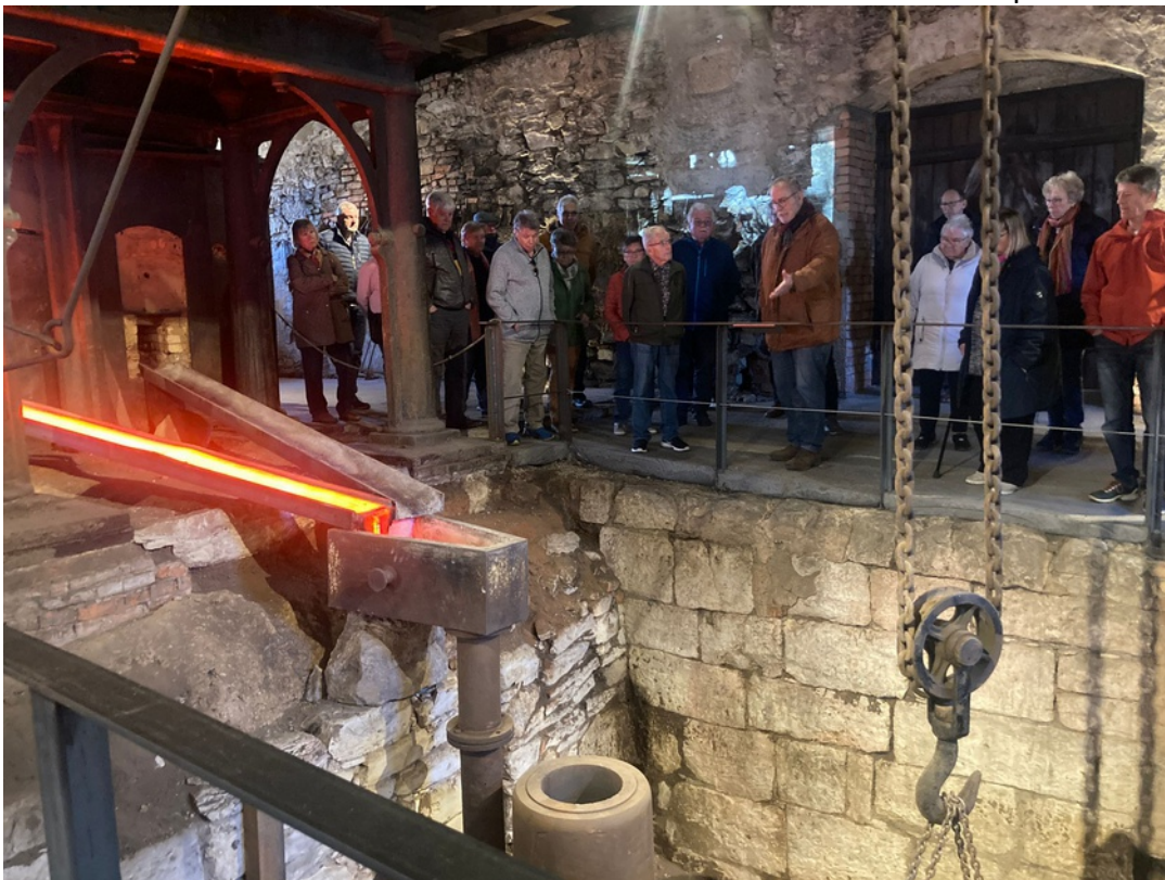
Besichtigung des historischen Flammofens bei den Hüttenwerken Königsbronn im März 2024